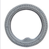
Quemador 32 cm