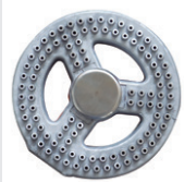
Quemador 18 cm