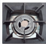
Parrilla 43x43 cm