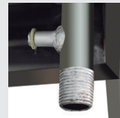
Conexión 1/2 HE