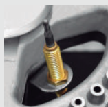
Termocupla de seguridad