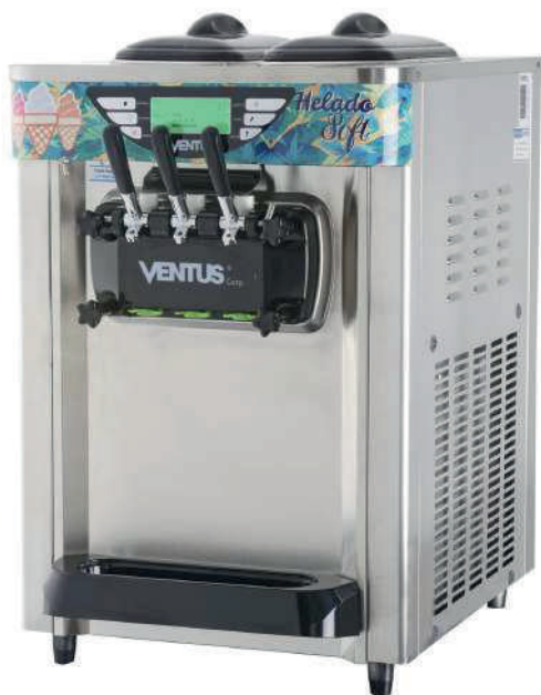
Panel touch Manillas sabores

Equipo especializado en producción de helado soft