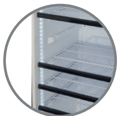
Repisas regulables Iluminación interior LED a ambos lados