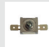
Sensor de temperatura de seguridad