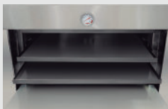
Interior horno acero inoxidable